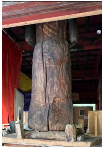
聖観音様の後ろの建具を外したところ、普段は観る事ができませんでした。ひび割れが確認出来ます。

歪みや建て付けの状況をみながら、隙間が出ないようにしたり、なるべく引き戸として機能する様にと敷居などの調整もしながらの作業となっています。