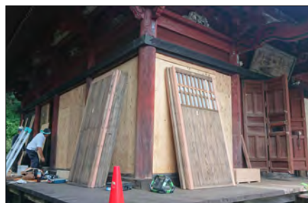
修復した建具を大日堂に戻す

さて、修復作業ですが、まず最初に建具を外し、大日堂には仮の建具を設置、外した建具は伽藍公舎に運び修復を行い、そ