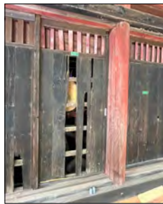
破損している建具

本年二月に終わった大日堂の縁回り修復に続き、大日堂の外壁・外部建具（引き戸形式）の修復が八月より開始されました。外壁、建具共に、長年の雨・風により、傷みが激しい所もあり、縁回り同様、早期の修復が必要となっていました。